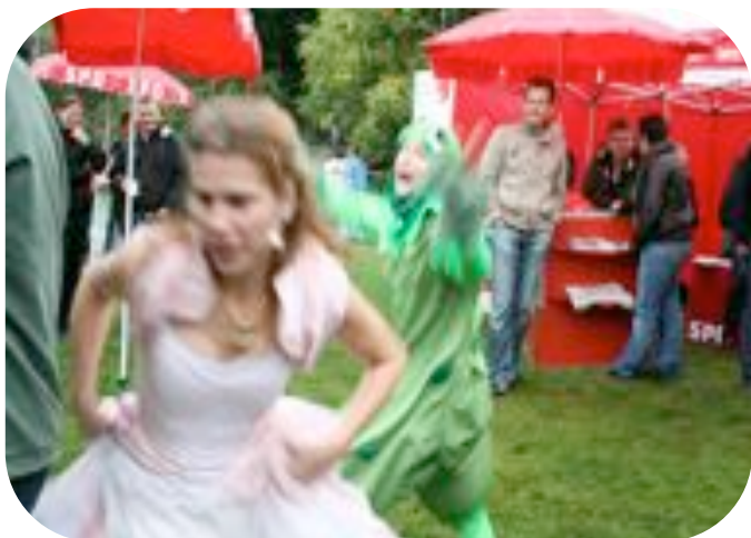
5. Kinder- und Familiefest 2010