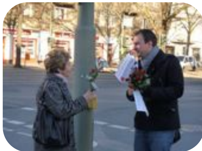
Aktion zu 100 Jahre Frauentag